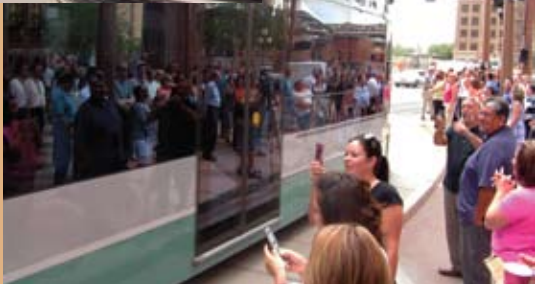
METRO tests into downtown Phoenix for the first time on July 10.