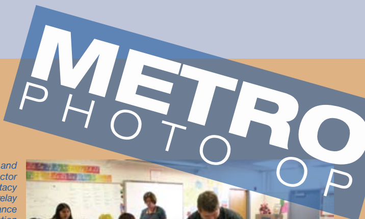
METRO and contractor Sundt Stacy Witbek relay the importance of construction safety to students of Thew Elementary School in Tempe.