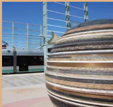
Artwork at the University/Rural station.

El programa de la Junta Asesora de la Comunidad de METRO (CAB, por sus siglas en inglés) está llegando a su fin en muchas áreas, ya que las obras del actual proyecto de la línea principal de 20 millas están por concluir. Las juntas trabajaron con diligencia durante los últimos dos años y medio para atender las inquietudes de la comunidad y supervisar los avances y la seriedad de cada contratista. METRO siempre le agradecerá a los miembros de la Junta por haber invertido tiempo y energía en el proyecto y por su disposición para compartir valiosas perspectivas.