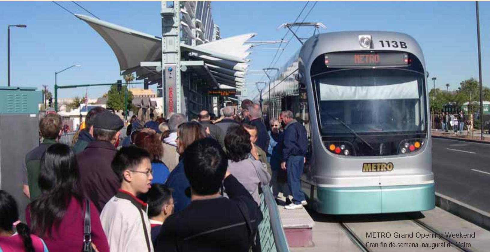
METRO Grand Opening Weekend Gran fin de semana inaugural de Metro

El Departamento de Transporte de Arizona pone a su disposición el servicio de información al viajero (511). Es muy sencillo, llame al 511 y podrá informarse sobre cierres de vías, construcciones, retrasos, servicios del transporte público, operaciones de los principales aeropuertos, turismo, condiciones climáticas, entre otros. Toda esta información estará disponible con tan sólo marcar tres dígitos: 5-1-1. También puede visitar la página Web antes de salir de su casa o de la oficina: www.az511.gov .