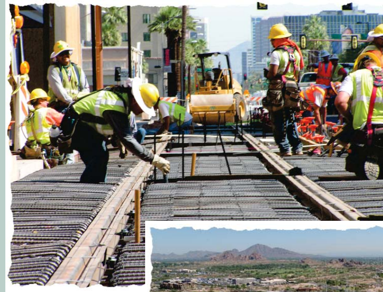
Installing track on Central Avenue at Adams Street

Hasta el momento los progresos en la LS-1 incluyen el reemplazo de la tubería de irrigación SRP en la avenida 19 con calle Camelback, la remoción de cordones y aceras en esa área y la extensión de los drenajes pluviales en la Camelback. La nivelación ya se inició en la calle Camelback como parte de la preparación para el trabajo de cordones, canales y aceras y la ampliación de la vía.