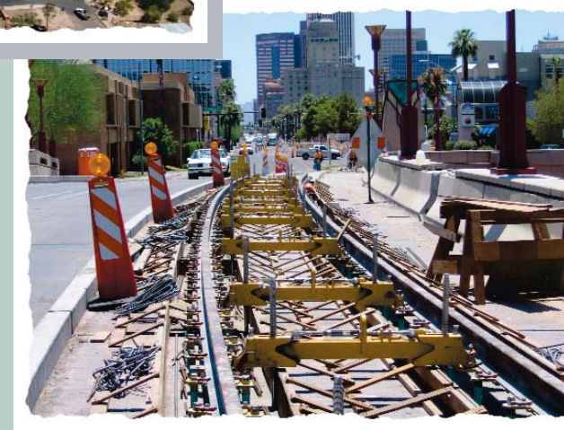
Deck Park track installation on Central Avenue

El trabajo realizado en el trimestre pasado involucró las reconstrucciones de los servicios públicos al este de la avenida Central, la remoción de los cordones y aceras a lo largo del lado este de la Central, entre las calles Camelback e Indian School y la reubicación de los servicios públicos al sur de la calle Indian School. Actualmente está en proceso la construcción en la mitad oeste del puente Grand Canal bridge.