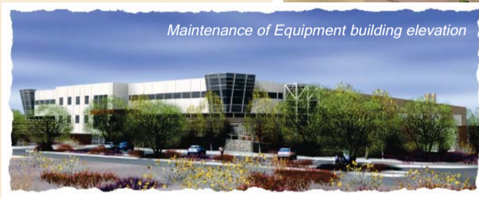
Maintenance of Equipment building elevation