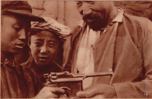
Oben: DIE FÜR CHINAS FREIHEIT SICH SCHLAGEN. Das obere Bild zeigt zwei chinesische Kommunisten, Bauernburschen aus der Provinz Shensi, das untere einen alten Bauern, der sich von einem jungen Kämpfer der Freiheitsarmee im Waffengebrauch unterrichten läßt, um sich dann einer Partisanenabteilung anzuschließen. (5-6)