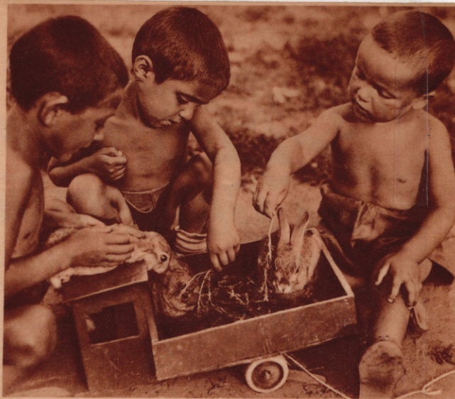
DREI KLEINE ZIGEUNER füttern ihre Kaninchen. Wo? Im Kindergarten für Zigeunerjungen und Zigeunermädchen auf einem großen Kollektivgut bei Moskau. Seitdem die Zigeunereltern nicht mehr im grünen Wagen herumzukttschieren brauchen, sondern vom Sowjetstaat Land und Häuser bekommen haben, begann auch für die Kinder ein anderes Leben.

Übrigens gibt es nicht nur in der Stadt Chabarawsk am Amurfluß Kinderkapitäne und Matrosen. Der Kulturpark in Moskau hat eine eigene Kinderabteilung und die besitzt auch schon einen richtigen Dampfer, auf dem Kinder regelrecht als Maschinisten, Matrosen und Steuerleute Dienst tun. Und auch auf diesem Dampfer ist nur ein erwachsener Ingenieur, der acht gibt, daß kein Unglück geschieht. Es ist aber bisher noch nie etwas Schlimmes passiert, denn die Kindermatrosen verstehen ihr Handwerk wie echtste alte Seebären.