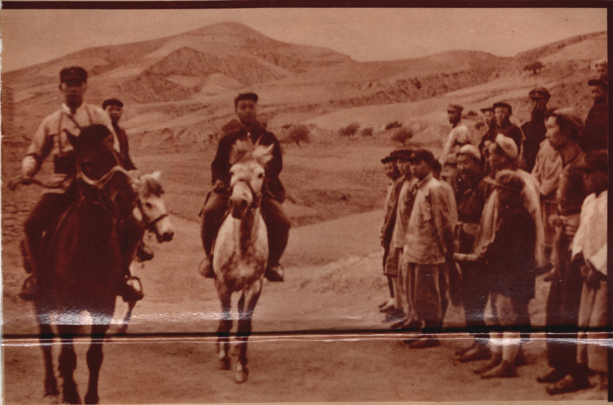
Unten: PATROUILLE DER VOLKSARMEE in einem Dorf an der Grenze des Rätegebiets von Nordwest-Shensi. (7)