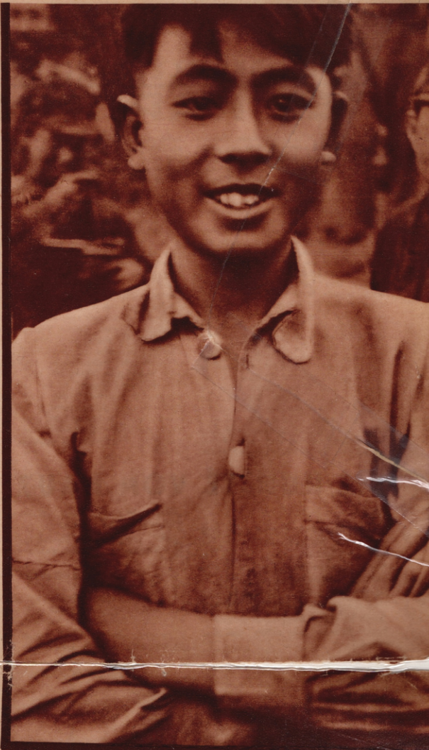
EIN JUNGER KÄMPFER. Sein Vater, ein kleiner Bauer, ist von den Weißen erschlagen worden, das Heimatdorf wurde von ihnen verwüstet. Er kämpft für den Frieden und die Freiheit des chinesischen Dorfs, des chinesischen Volks. (4)

Liest man diesen Bericht, so drängt sich einem unwillkürlich der Vergleich mit Spanien auf. Der gleiche Kampf eines blutendes Volkes gegen die Bevorrechteten, die lieber Brand und Krieg über „ihr“ Land bringen, als von ihren Vorrechten zu lassen. Der gleiche Kampf gegen verräterische Generäle, die von ausländischen Imperialisten unterstützt werden. Der gleiche Heldennut namenloser Volkshelden, die sich die Waffen vom Feind holen müssen. Und das gleiche große Ziel: Freiheit, Friede und Fortschritt!