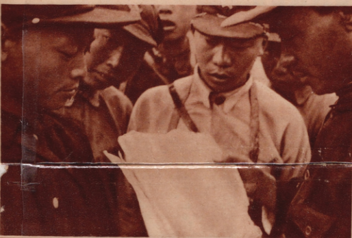
Links von oben bis unten: Die Kommandeure einer neuangestellten Division der chinesischen Volksarmee in der Provinz Shensi bei der Befehlsausgabe. — Ein Bauernbursch ist gekommen, um in die Volksarmee einzutreten; ein Junger Kämpfer erteilt ihm ersten politischen Unterricht. — Eine Jugendspieltruppe, die für Armee und Bevölkerung der Rätegebiete Theaterstücke aufführt. (1-3)