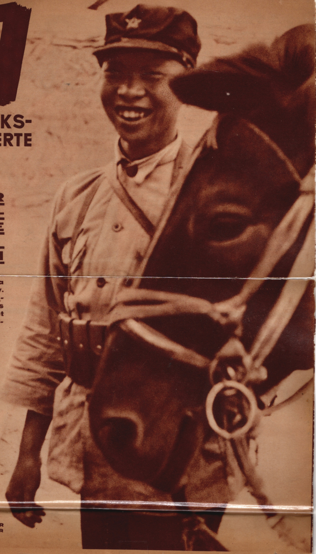
JUNGER CHINESISCHER ROTARMIST AUS DER PROVINZ SHENSI

Großer Bildbe- richt aus China von A. Smedley. Erste Original- aufnahmen aus dem Rätegebiet von Nordwest- Shensi