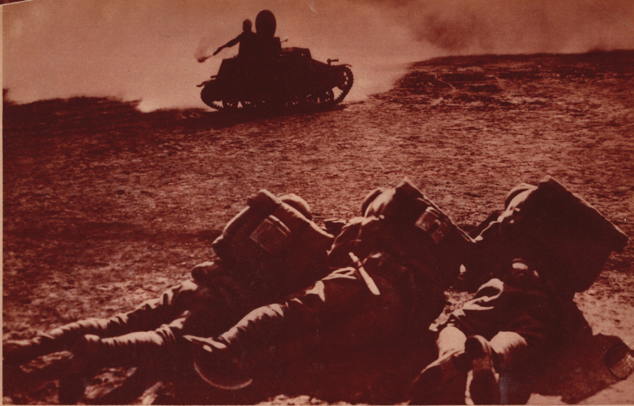
DAS UNERSÄTTLICHE JAPAN. Immer neue chinesische Gebiete werden von der japanischen Armee besetzt. Aber das genügt den Herren in Tokio nicht. Sie rüsten zum Krieg gegen die Mongolei, zum Krieg gegen die Sowjetunion. — Tankmanöver der Japaner. Der Berichterstatter des „Völkischen Beobachters“, der diesen Manövern beiwohnte, schrieb die vielsagenden Worte, daß „im Ernstfall der japanische Soldat in sibirischem Klima“ werde kämpfen müssen!

Posten zu finden. Ich fragte jedoch nur: „Ich hörte von einem japanischen Angebot an General Yen Schuh-schan, dem die Regierung über einen von Japan kontrollierten, unabhängigen nordchinesischen Staat von fünf Provinzen versprochen wurde. Stimmt das?“ „Darin steckt ein Körnchen Wahrheit. Doch General Yen wies die Japaner nach Nanking. Wenn Nanking einwilligt, würde er annehmen.“ „Verlangten die Japaner ein Militärbündnis gegen die Sowjetunion?“