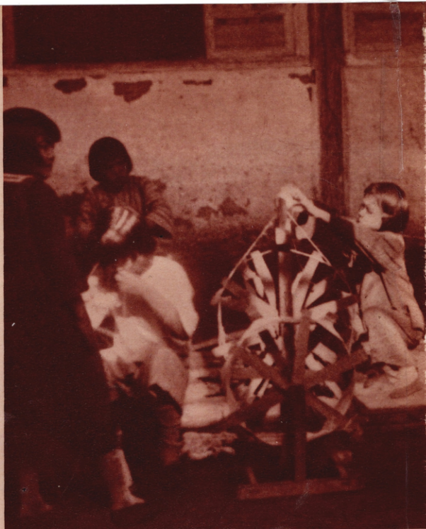
SAUER VERDIENTE WOHLTATEN. Kinder, die aus den Hungergebieten Nordchinas geholt wurden, müssen sich in den Missionsanstalten durch Spinnen den Napf Reis verdienen, der sie vor dem Verhungern schützt.

sei der Beweis, daß Tschan-Kai-Schek wirklich kämpfen wolle? Nun, er hatte seinen politischen Sekretär nach Tientsien gesandt. Zu welchem Zweck aber? Um gegen die Japaner zu kämpfen oder mit ihnen zu paktieren? Hat nicht Tschan seine Truppen aus dem Norden zurückgeholt? Hat er nicht heimlich mit dem japanischen Gesandten in Nanking verhandelt? Hat er nicht Dr. C. T. Wang, den früheren Außenminister nach Tokio gesandt, um über eine geheime japanische Anleihe zu verhandeln?