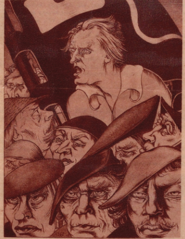
... Handwerker, Bauern, Hungernde! Da hinten reiten sie das Tal herauf, die Wucherer!“

Das war der erste Sieg des Bundschuhs in der Lausitz; die Eisenmünzen wurden eingezogen. Aber auch Enderlins Ruf ist nie wieder verstummt. Stets, wenn sich das geaußelte Volk erhob, dann klang er auf durch die Jahrzehnte und Jahrhunderte — bald schon als Thomas Münzer die Entscheidung gegen Luther, Papst und Fürsten suchte — dann später gegen Kaiserliche und Schweden, die Weber gaben ihn von Dorf zu Dorf, und das Volk von 1848 nahm ihn auf, den Ruf des alten Bauernführers Enderlin, den Kampfruf jeder Volksfront: „Weiter! Weiter! Weiter!“