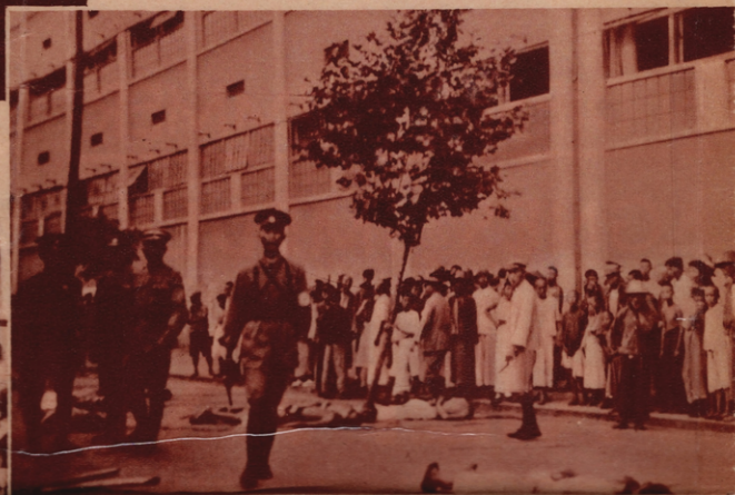
Oben: NUR GEGEN DEN „INNEREN FEIND“ BRAUCHT TSIANG-KAI-SCHEK DIE GEPANZERTE FAUST. Chinesische Arbeiter werden wegen „revolutionärer Gesinnung“ aus der Fabrik geholt und vor ihr erschossen. Vorn der Nanking-Offizier hält noch die rauchende Pistole in der Hand.