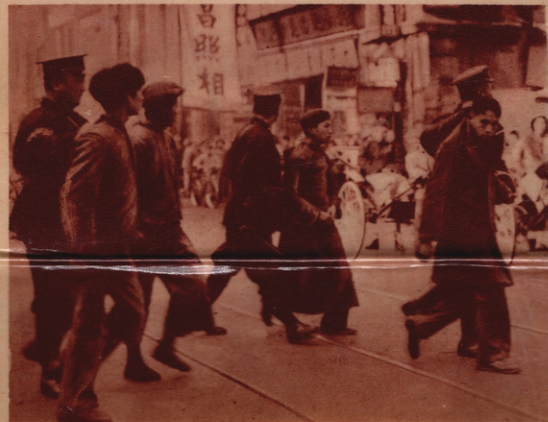
Unten: VERHAFTUNG VON STUDENTEN UND ARBEITERN, die gegen Japan demonstrieren und Nankings Politik des Zurückweichens und Faktierens verurteilen.