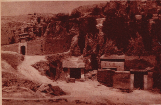
Links: EIN DORF IN NORDCHINA. Die Hütten sind in die Felswände gebaut. Klein sind die Felder, groß ist der Hunger, unerträglich der Druck der Steuern und Brandschatzungen.

Einige Zeit später wiederholte ich diese Unterhaltung vor einer anderen Gruppe Menschen, die auch zur herrschenden Klasse Chinas gehörten und viele fanden kein Unrecht in diesen Meinungen. Noch später sprach ich eine Reihe Professoren aus dem Norden, sie bestätigten nur, was ich bereits gehört hatte. Sie bereiteten sich vor, aus Nord-China zu fliehen, gradenwegs nach Szechuan, ohne auch nur in Nanking Halt zu machen, wie der Philosophieprofessor geplant hatte. Wie ein Staub flohen sie über China. Zur Rechtfertigung sagten sie, Tschan-Kai-Schek wolle gegen die Japaner kämpfen, ihre Anwesenheit in der Kriegszone sei überflüssig. Und was