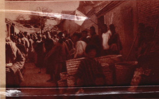
GIFTHANDEL UNTER JAPANS FLAGGE. Unter dem Schutz der japanischen Flagge und der japanischen Waffen werden überall in Nordchina Kokain-, Heroin- u. Opiumhändler eröffnet. Japanischer Bauergräben in Sain-Ho, Nordchina.