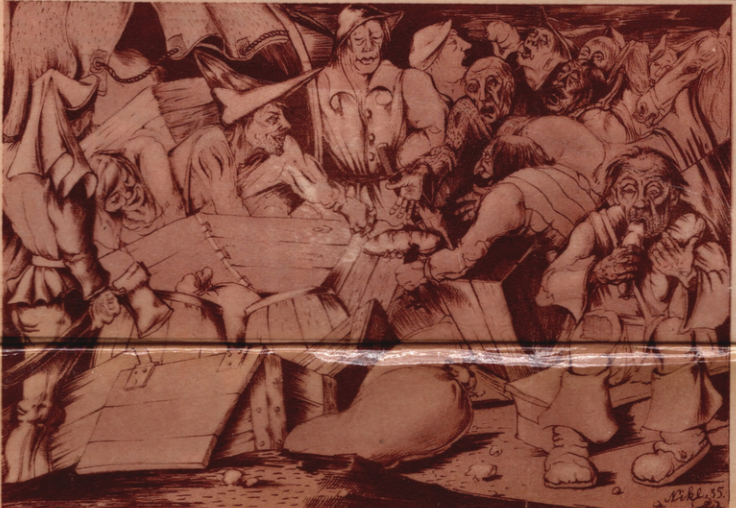
... die ausgemergelten Gestalten drängten sich, schlangen gierig, schrien nach mehr.“