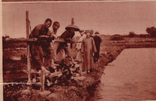
TRETMÜHLE. Zur Bewässerung der Felder dient ein primitives System von Kanälen und Pumpen, die durch Menschenkraft in Gang gesetzt werden. Das Geld, das zur Verbesserung der Landwirtschaft verwandt werden könnte, wird von den ewigen Kriegen gefressen.