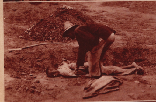
TOD AN DER LANDSTRASSE. Neben den Chausseen in Nordchina findet man oft die Leichen Verhungerrter. Sie sanken vor Erschöpfung um und starben. Ein vorüberkommender Bauer gräbt den Toten ein.