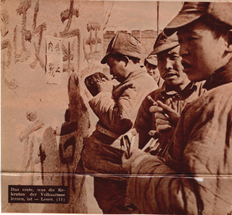
Das erste, was die Rekruten der Volksarmee lernen, ist — Lesen. (11)

In Nordchina donnern seit Tagen die Geschütze. Menschen fallen und werden verwundet; Dörfer gehen in Flammen auf. Und nebenher wird von den beiden kämpfenden Parteien verhandelt. Diplomatische Noten gehen hin und her, ein Ultimatum wird gestellt, zurückgewiesen, erneuert. Denn das ganze ist zwar richtiger Krieg, heißt aber nicht so, weil der faschistische Angreifer wie in Spanien ohne Kriegserklärung und unter dem Schein von Neutralität, Nichteinmischung, Abwehration oder wie sonst die schönen Wörter lauten, seinen brutalen Überfall maskiert.