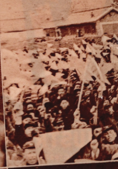
Eine Massenversammlung in Jenan, der Hauptstadt des nordchinesischen Rätegebietes.