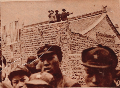
Der Unterricht beginnt! Durch Trompetensignale werden die Studenten der Jenaner Militärschule in die Klassen gerufen. Sie erhalten hier nicht nur militärwissenschaftlichen, sondern auch politischen Unterricht. (4)