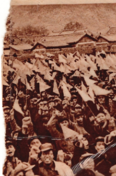
te, fordert die Volksfront gegen die japanischen Eindringlinge. (3)