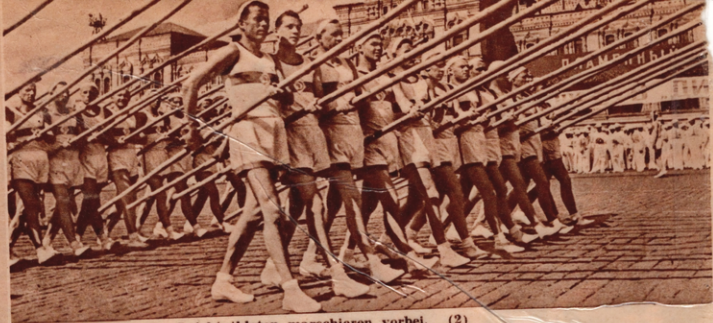
Die Leichtathleten marschieren vorbei. (2)