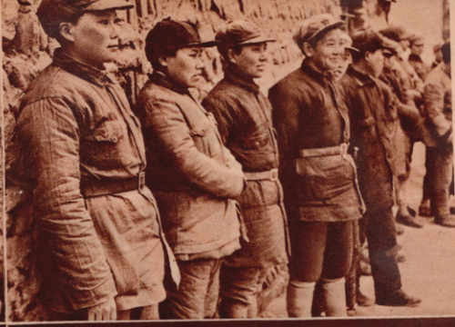
Studentinnen der Militärhochschule von Jenan (neben Männern studieren hier auch viele Frauen) sehen einem Basketballspiel zu. Die erste von links ist die Frau Tschutehs, des Oberbefehlshabers der Volksarmee. (5)