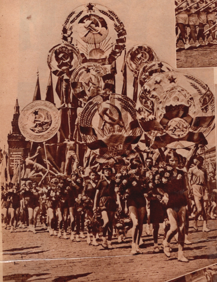
Die Staatswappen der Bundesrepubliken werden in einer lebenden Pyramide von Turnern im Zug getragen. (1)