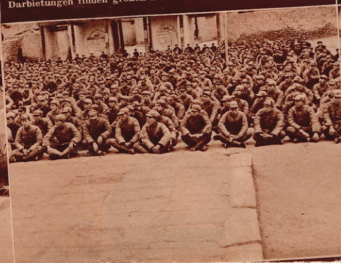
Die Praktiker des Krieges erhalten theoretische und politische Ausbildung. Eine Klasse von Offizieren in der Militärhochschule von Jenan folgt dem Vortrag des Lehrers. Links hinten schauen ein paar Zaungäste über die Mauer interessiert zu. (7)