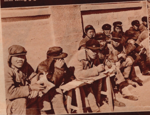
Lernen! Lernen! Das ist die große Lösung im chinesischen Rätegebiet. Überall werden Schulen für Kinder und Erwachsene errichtet. Hier sehen wir Schüler — Bauern und Arbeiter aus der Nähe von Jenan — beim Unterricht unter freiem Himmel. (6)