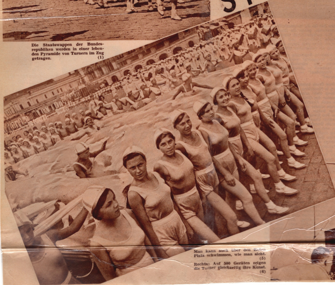
Man kann auch über den Roten Platz schwimmen, wie man sieht. (5) Rechts: Auf 500 Geräten zeigen die Turner gleichzeitig ihre Kunst. (6)