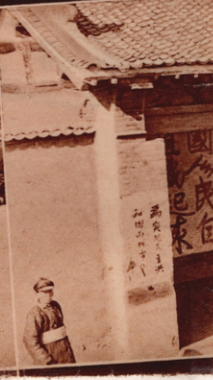
Das ist der Haupteingang zur „Hochschule für militärische und po-