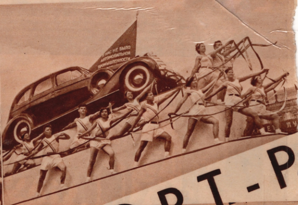
Unten: Der neue »SIS«-Wagen zeigt den Aufschwung der Autoindustrie. (3-4)