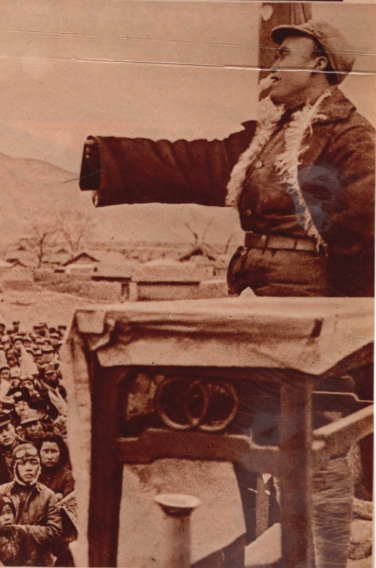
Oben: Tschuteh, der berühmte Führer der Volksarmee. Links: Ein Bauer aus dem Gebiet von Jenan in seinem weißen Fellrock. Die Urbewölkerung ist hier nicht chinesisch, sondern turko-mongolisch. (13)