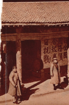
litische Wissenschaften" in der Hauptstadt des nordchinesischen Rätegebiets Jenan. (8)