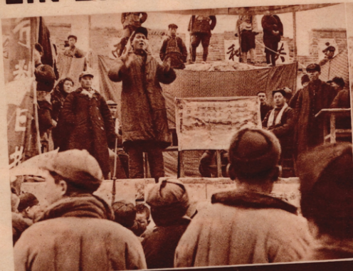
Maotsetun, der Vorsitzende der Regierung und des obersten Kriegsrates der chinesischen Rätegebiete bei einer Massenversammlung. Er sagte Tschangkaischek volle Unterstützung in einem Krieg gegen den Eindringling Japan zu. (1)