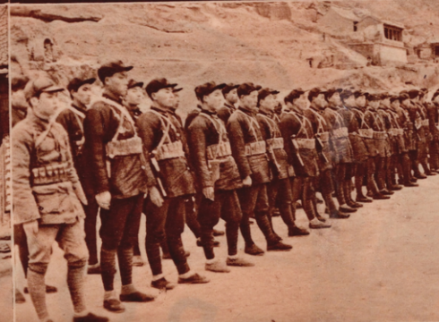
Die Soldaten der Volksarmee (»Armee der antijapanischen Einheit«, früher Rote Armee) werden sorgfältig ausgebildet. Oben: Infanterie. Links daneben: Kavallerie beim Exerzieren. (9-10)